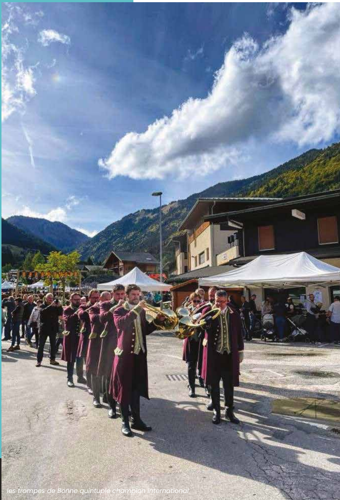
les trompes de Bonne quintuple champion international