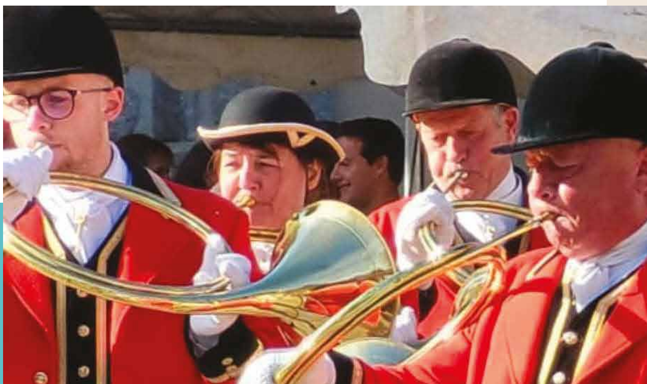
Les trompes de Neuvecelle